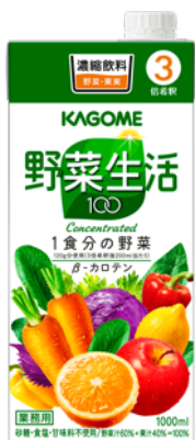
野菜生活100 3倍濃縮 1L