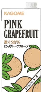
ピンクグレープフルーツ 1L