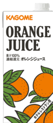
オレンジジュース 1L