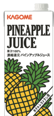
バインアップルジュース 1L