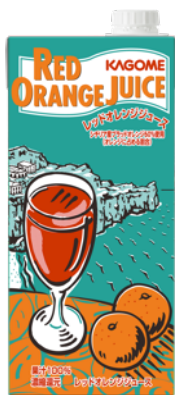
レッドオレンジジュース 1L