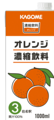
オレンジ濃縮飲料3倍濃縮 1L