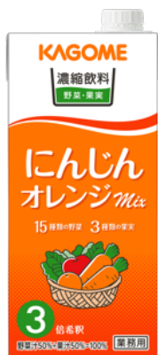
濃縮飲料にんじん・オレンジミックス3倍濃縮 1L