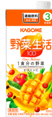
野菜生活100イエロー 3倍濃縮 1L