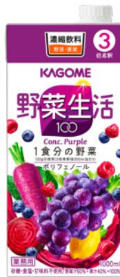
野菜生活100パープル 3倍濃縮 1L