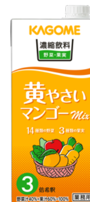
濃縮飲料黄やさい・マンゴーミックス3倍濃縮 1L