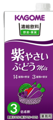
濃縮飲料紫やさい・ぶどうミックス3倍濃縮 1L