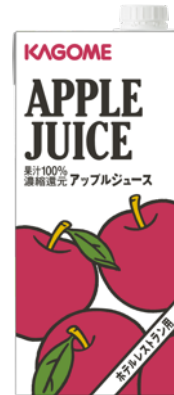
アップルジュース 1L