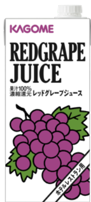
レッドグレープジュース 1L