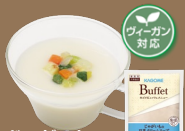
じゃがいもの 豆乳クリーム スープ ～ヴィシソワーズ風～