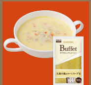
大妻小妻の コーンスープR