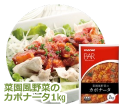
菜園風野菜の カポナータ1kg