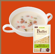
6種野菜と2種豆の 彩りクリームスープ