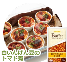
白いんげん豆の トマト煮