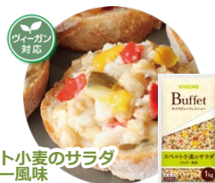
スベルト小麦のサラダ ピネガー風味