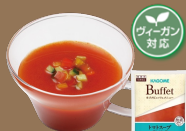
トマトスープ ～ガスパチョ風～