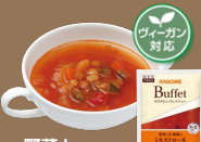
野菜と 豆・穀類の ミネストローネ